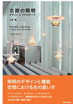
北欧の照明 (学芸出版社, 2019)