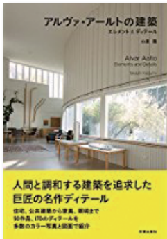
アルヴァ・アールの建築 (学芸出版社, 2018)