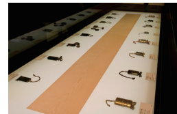
参考例 九州国立博物館「印籠展」展示計画, 2014