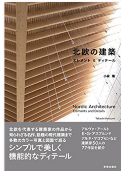
北欧の建築 (学芸出版社, 2018)