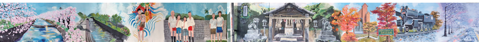
トンネル壁画完成イメージ