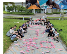
王塚古墳祭りトリックアート