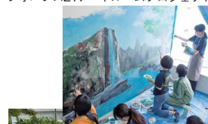
レオパレス21アートルームプロジェクト