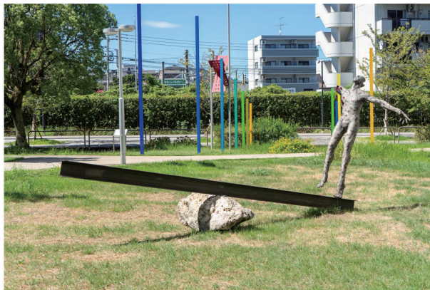
大学内における野外展示