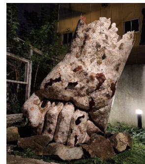
Resonate gallery wabi presents 直方市・忘覚庵