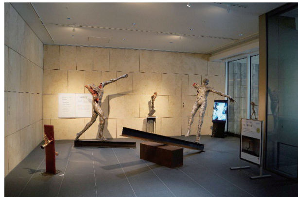
東京ガーデンテラス紀尾井町 オフィスエントランスでの展示