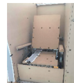
デジタル傾斜レベルで角度計測