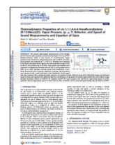
低GWP冷媒の国際標準状態方程式に関する論文

アメリカ、ドイツ、イタリア、中国の研究者と共同で低GWP冷媒の熱物性標準化を進めている。