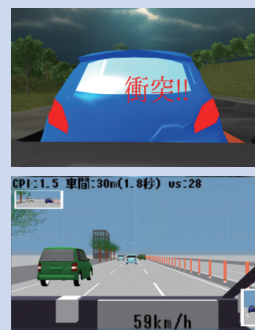
ドライビングシミュレータ