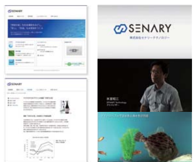
デザイン学科 / 佐藤美紀 / 映像