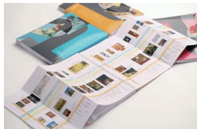
デザイン学科 / 兵頭美那海 / グラフィックデザイン