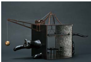
美術学科 / 匹田悠貴 / 金工