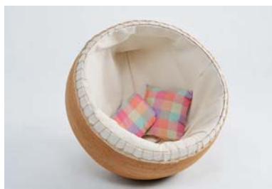
デザイン学科 / 村田綾香 / プロダクトデザイン