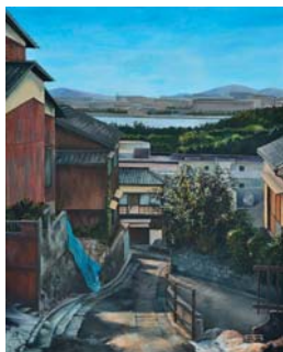
美術学科 / 麻川絵美 / 洋画

本日は学生の作品をゆっくりご覧いただき忌憚のないご意見を聞かせていただければ幸いです。