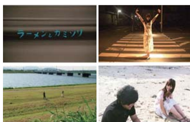
写真映像学科 / 田川隆介 / 映像