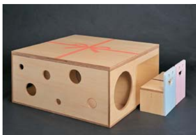
デザイン学科 / 梁井美帆 / プロダクトデザイン