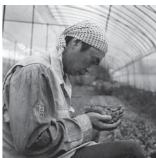
写真映像学科 / チェン テレンス / 写真