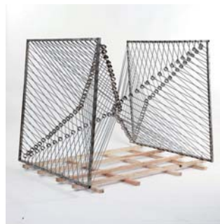
美術学科 / 宮田雅洋 / 彫刻