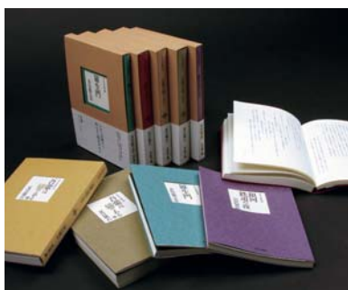
デザイン学科 / 川尻みゆき / グラフィックデザイン