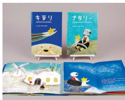
デザイン学科 / 田中明日佳 / グラフィックデザイン