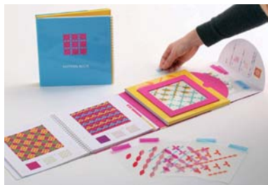
デザイン学科 / 竹内南菜子 / グラフィックデザイン