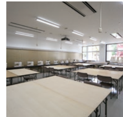
ファッションデザイン実習室

1階にファッションデザイン実習室とデザイン書道実習室があり、併設する九州産業大学美術館にもアクセスできます。