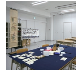
デザイン書道実習室