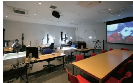
映像実習室・録音室