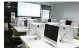
デジタルアトリエ