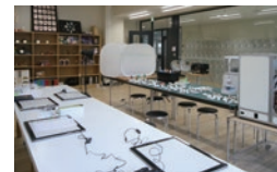
クリエイティブ工房

学部事務室、デジタルアトリエ、絵画室などがあり、多くの学生が集う建物です。2階には、ガラス張りのデザイン実習室が並び、明るく開放的な雰囲気の中で授業が行われます。