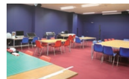
ビジュアルデザイン領域演習室