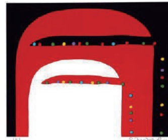
元永定正《あかしらいろだま》2010 年

開館 20 周年を迎える九州産業大学美術館の所蔵品展。そのコレクションは、1966 年に創設された芸術学部の特徴を反映したものです。本展では、国内外の絵画・版画・彫刻・工芸・デザイン・写真などの様々なジャンルの作品の中から優品を選び、制作された時代ごとに一堂に会して紹介します。コレクションをたどりながら、その魅力を体感できる展覧会です。