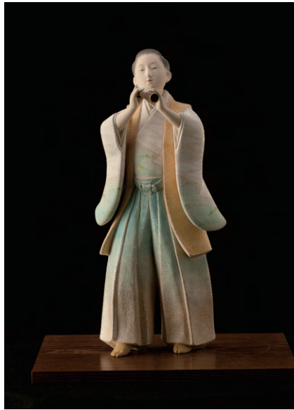
遙かな国 (1997年) 株式会社中村人形蔵

中村は一つの作品が完成に至るまでに、歴史的背景への徹底した調査を行い、モデルとなる人物が歩んでであろう道に自ら立ち、感じたであろう空気を感知、モデルと自らを重ね合わせます。そうして作品に込めた尊敬と祈りの念は、見る人の心を揺さぶり、感動を生むこととなるでしょう。本展では、人形師中村信喬の初期の学生時代の作品から近作「エヴァンゲリオン」を含む40余点を展示し、紹介することで、固定観念にとらわれず、意外に、そして自由に挑戦し続けるプロの姿をご覧ください。