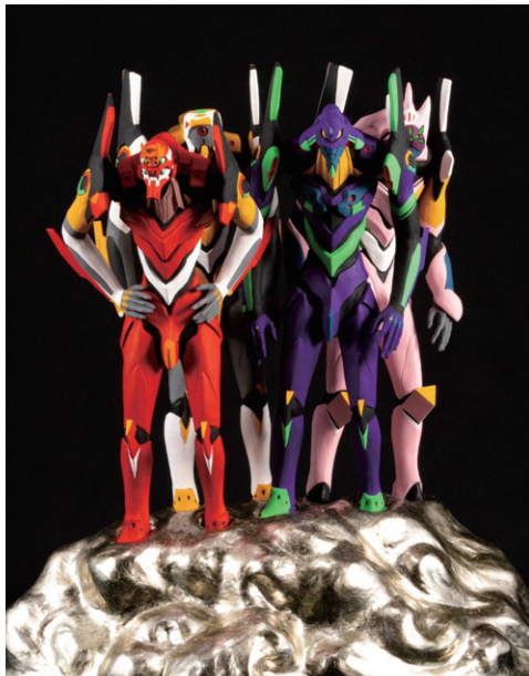
エヴァンゲリオン (2021年) 福岡運輸株式会社蔵