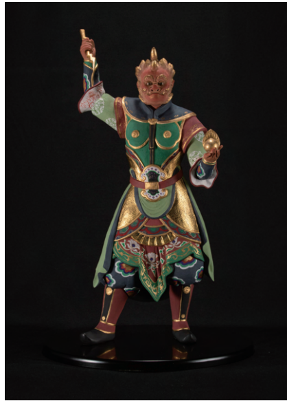
雷神 (2019年) 株式会社平和電興蔵