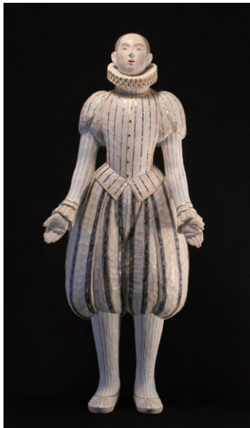
大聖堂 (2011年) 株式会社中村人形蔵