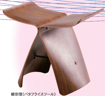
柳宗理(バタフライズツール) 1956年