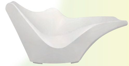
吉岡徳仁(TOKYO-POP Day-bed) 2002年