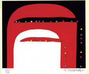
元永定正(あかしろいろだま) 2010年