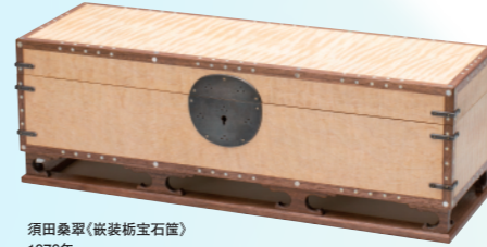
須田桑翠(嵌装板宝石篋) 1976年