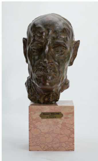
高田博厚《ロマン・ロラン》(1961)

本展を通して、コロナ禍において、たとえマスクで表情が分かりづらくても想像力を生かすことで、コミュニケーションがより豊かなものとなることを期待します。