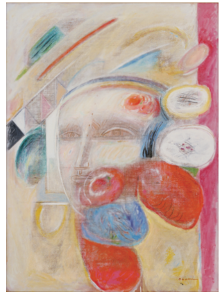
大沼映夫《花の中の虹の顔》(1987)