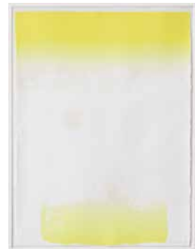
記憶の行方 B1 リトグラフ 1999