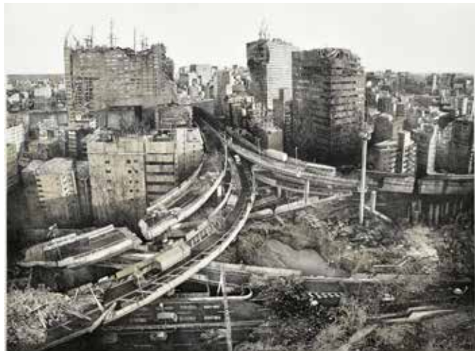
Foresight: Hakozaeki JCT 69×93cm 制作年：2019年 技法：リトグラフ