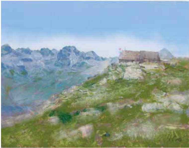
セガンティーニの小屋 F50 キャンバスに油彩 2021