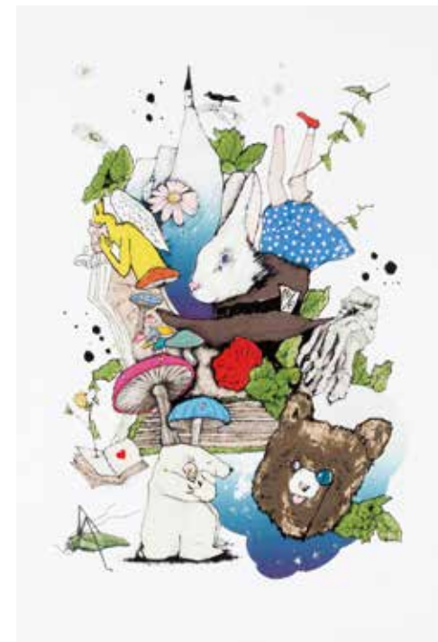
『Alice』 技法：リトグラフ 560cm×400cm