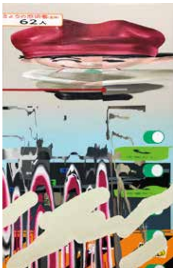
「スクショする風景」 キャンバスに油彩、アクリル絵の具 2020年