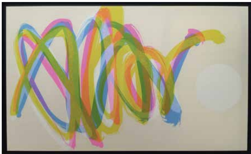
Turning point M100 デジタルプリント 2008