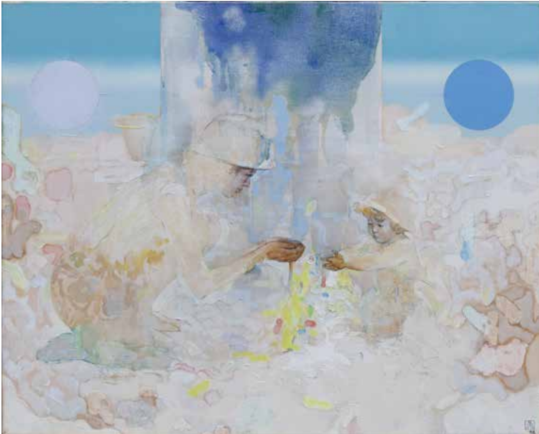
風図鑑<渚にて> F30 キャンバスに油彩 1994

●受賞：'92版画[期待の新人作家]大賞展 買上賞受賞／ 第8回アジア国際美術展日本委員会奨励賞 受賞／ 第1回谷尾美術館大賞展 優秀賞 受賞