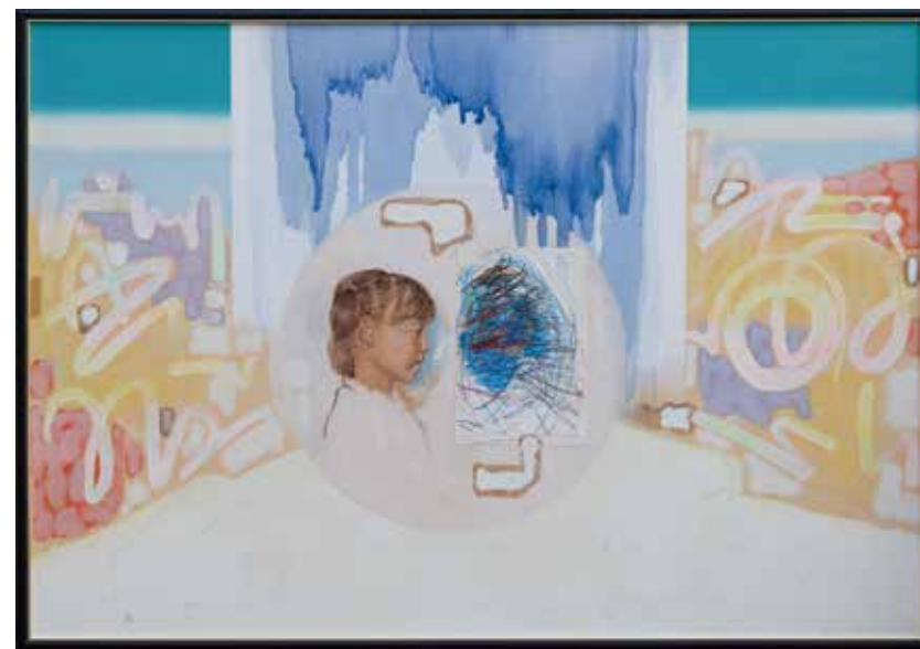
風図鑑 <AI-a> P100 キャンバスに油彩 1995