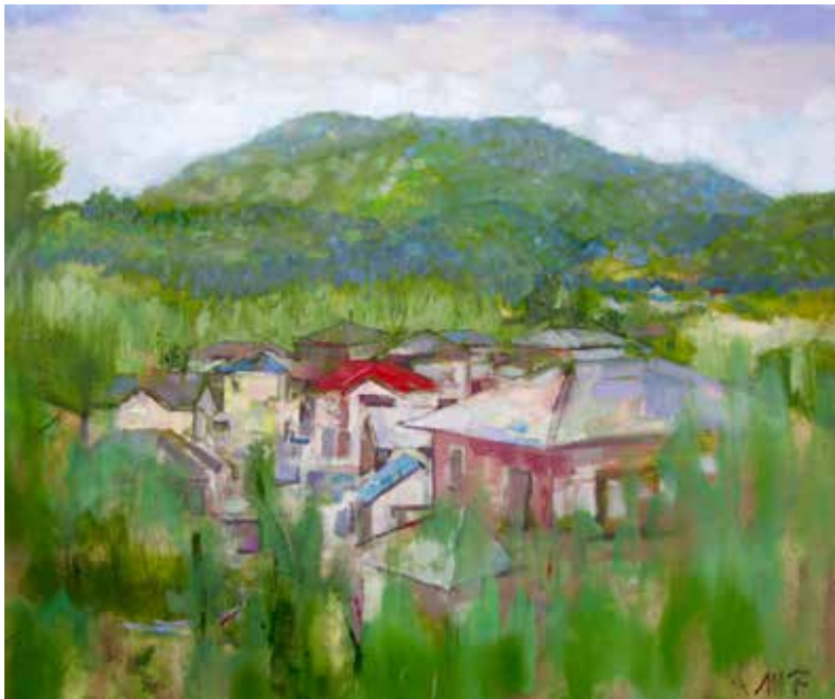
孔大寺 F20 キャンバスに油彩 2018