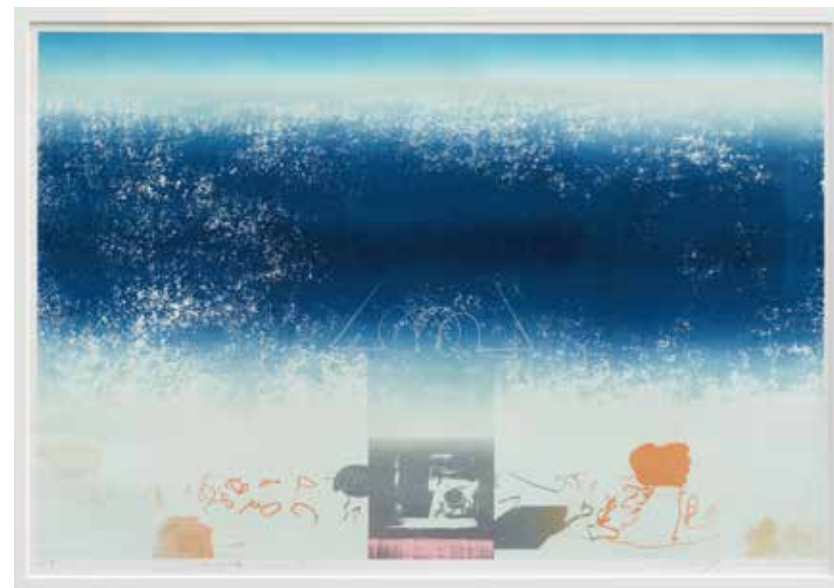
風図鑑 <Ai> B1 リトグラフ 1993

ご高覧いただきまして御指導を賜り、退任後は思い残すことなく画業に専念させていただくことができれば幸いです。