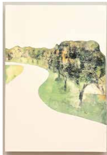
変わらぬ風景—街路樹2 サイズ：70×52cm 技法：凹版画 石膏刷り

日本美術家連盟会員、福岡市美術家連盟会員、 福岡県美術協会会員、版画学会会員、日本版画協会会員、 アジア美術家連盟日本委員会運営委員