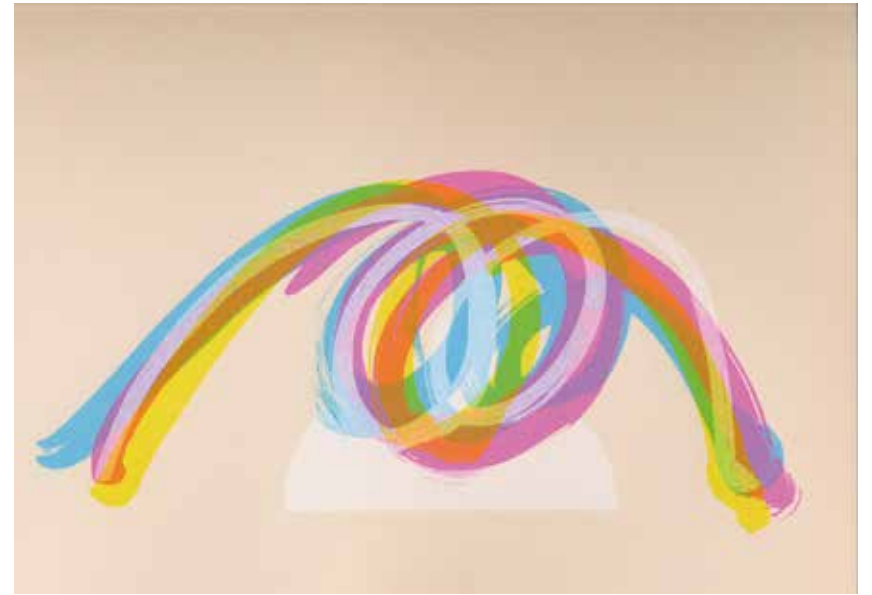
turning point B1 リトグラフ 2008