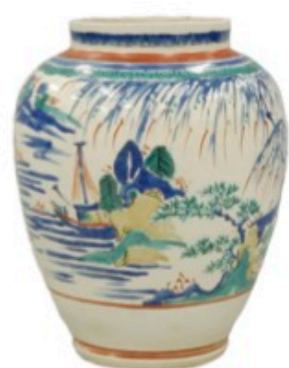
色絵楼閣山水文壺 1660年代

焼成比較作品、土型のレプリカ、柿右衛門様式磁器の再現作品、研究資料等を展示します。