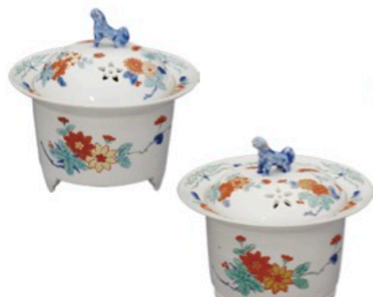
合成原料・天然原料の比較作品