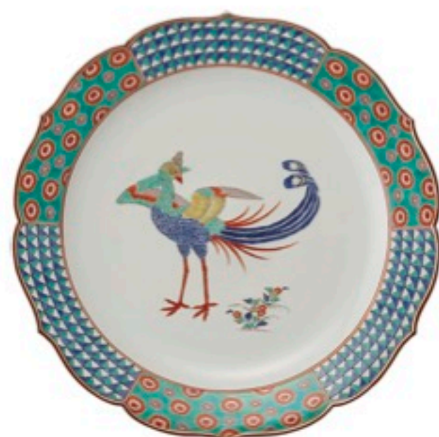
濁手花鳥文桔梗縁皿 十三代酒井田柿右衛門