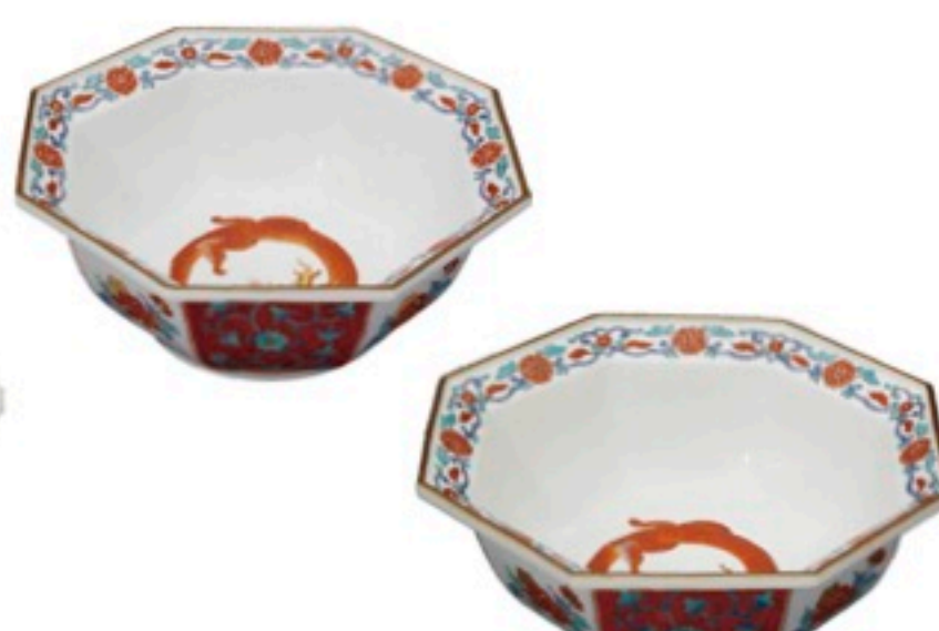
上絵電気窯・上絵薪窯の比較作品