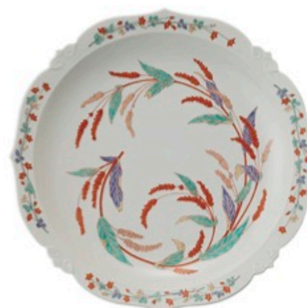
濁手蓼文額皿 十四代酒井田柿右衛門