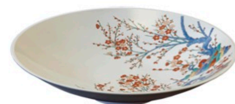
濁手梅花文鉢 十五代酒井田柿右衛門