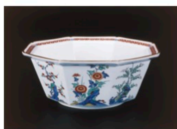
濁手草花文八角深鉢 十二代酒井田柿右衛門