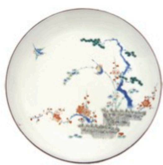
色絵柴垣双鳥松竹梅文皿 1670~1690年代