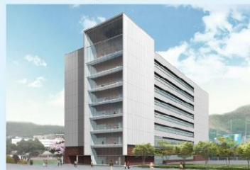
文系新棟 (平成30年1月竣工予定。 地上8階建、延床面積16,667,45㎡)