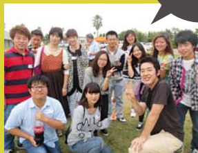
留学生との交流バーベキューイベントの様子

外国人留学生と友だち になりたいなら、国際交 流センターへ。留学生と 日本人学生と一緒に楽し めるイベントも多く、 楽しく仲間の輪が広が ります。