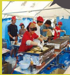
県人会でのイベント活動の様子

同じ出身地同士をつなぐ のが県人会。九産大には、九 州・沖縄の各県人会をはじめ、東日本、関西・中部、四国 東南、愛媛、山陰(島根・鳥 取)、広島、山口の各県人会 があり、会合やイベントを通 じて交流を深めています。