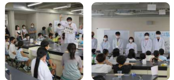
※2022年度講座(夏季)の様子