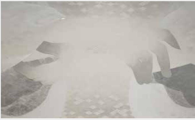
仲間琉妃 「このまま」 2025年 M100 パネルに麻紙、墨、胡粉、水干絵具、岩絵具、箔