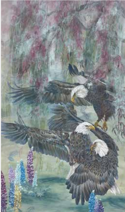
園田瑞穂 「欲の果て」 2025年 1620×970mm 麻紙、水干絵具、岩絵具、胡粉