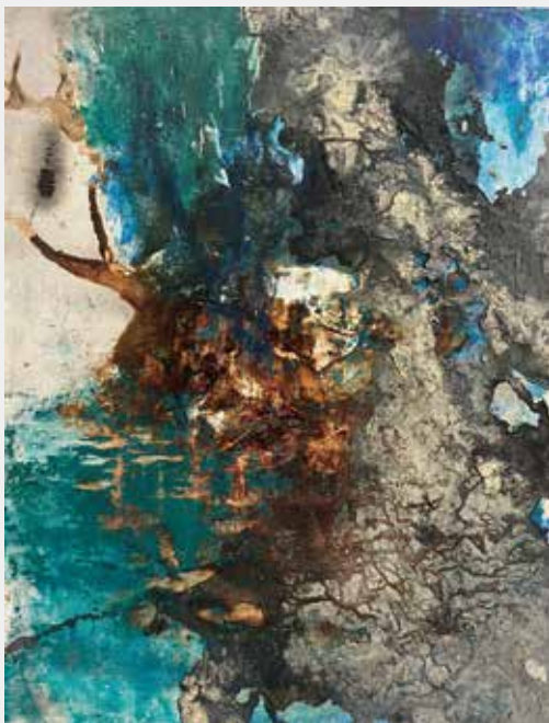
江渕慎平 「永劫回帰 杜」 2025年 650×500mm パネルに粘土、墨、油彩、蜜蝋