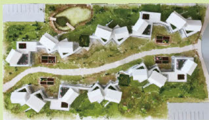
【人と人、人との社会の距離に注目した集合住宅の設計】 (卒業設計)

九州産業大学 住居・インテリア学科では、豊かで潤いのある暮らしを創出する住居・インテリア領域の技術者の育成をめざしています。学生たちが卒業制作及び卒業研究として取り組んだ成果を展示いたします。