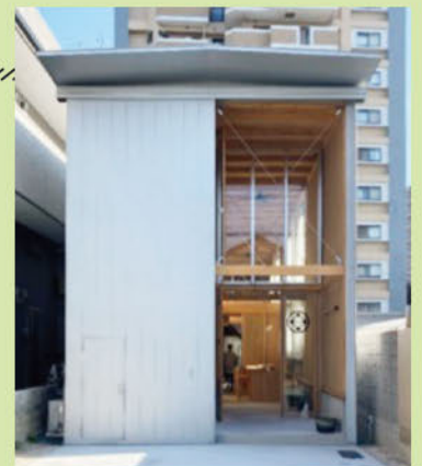
【住宅の部 大賞作品】 houseG / shopG 一級建築士事務所木村松本