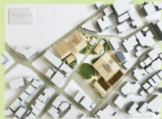
【発達障がい児の自立支援とその母親の"居場所"の在り方】 (卒業設計)