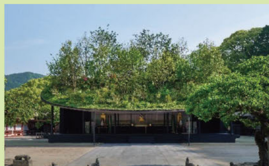
【一般建築の部 大賞作品】 太宰府天満宮 仮殿 株式会社藤本杜介建築設計事務所

「福岡県美しいまちづくり建築賞」は、福岡県内の個性豊かで美しく、良好な景観を形成する建築物を表彰し、美しいまちづくりに対する県民意識の醸成を図ることを目的として実施しています。今回は、ご応募いただいた47の作品の中から、幅広い分野の学識経験者などで構成する選考委員会による厳正な審査を経て、特に優れた作品が大賞、優秀賞として表彰されました。