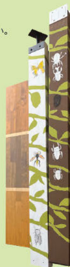
【学生食堂空間の音響性能評価】 (卒業研究)