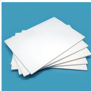
B2 スチレンボード 5mm 厚 (739 円)