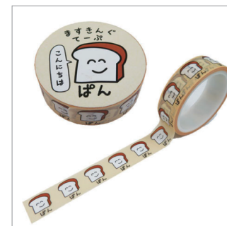
マスキングテープ (幅 1~2cm) ※所有していれば購入不要