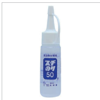
スチレンのり 50ml (376 円)