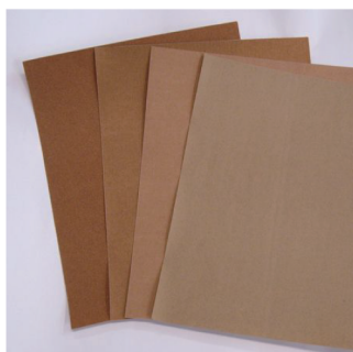
木工用サンドペーパー 180 番手 (36 円)