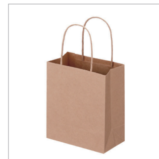
紙袋 (40×55×10cm が入るもの) ※所有していれば購入不要