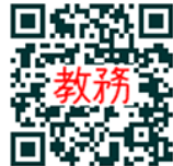
※「九産大 教務部」で検索しても教務部HPを確認できます。