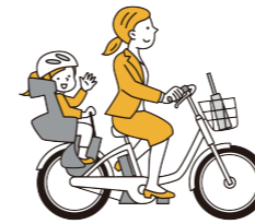
家事・育児は女性の仕事