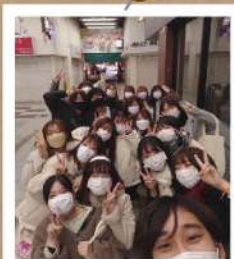
ワークキャンプ同好会