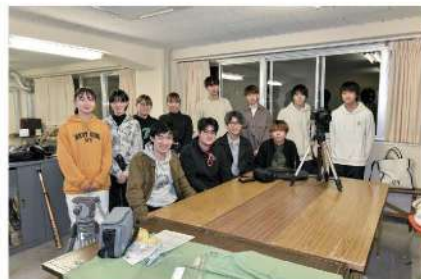
映画研究部 イベント名:自主映画上映会 場 所:1号館2階S201 開催日時:5月22日(日)12:00~16:00