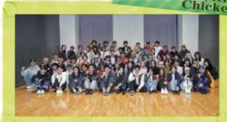
ストリートダンス同好会 Chicken