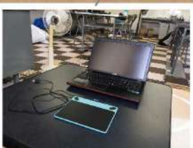
デジタルアート部