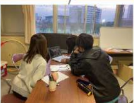
九産大ほうけん王同好会