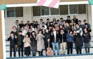
アコースティックギター同好会