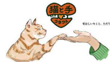
ねこ愛好会 イベント名:猫と手 コネクト 場 所:8号館前 開催日時:5月21日(土)11:00~17:00 5月22日(日)11:00~17:00