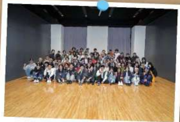
ストリートダンス同好会Chicken