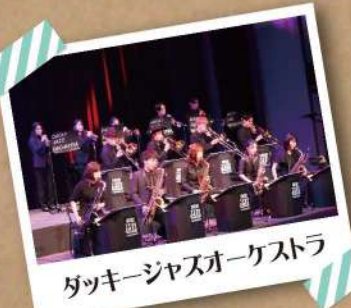
ガッキージャズオーケストラ