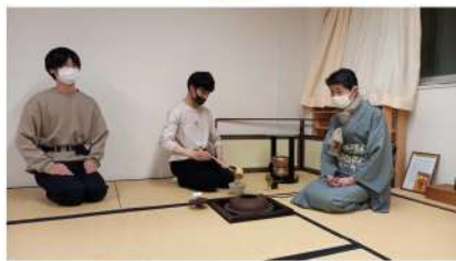
裏千家茶道部 イベント名:学文祭茶会 場 所:8号館1階ホール 開催日時:5月22日(日)12:00~15:00