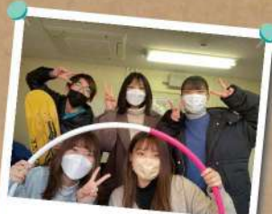
九産大ぼうげん王同好会