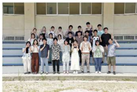
演劇研究部 イベント名:公演 場 所:学友会棟中央棟1階大会議室 開催日時:5月21日(土)12:00~16:00 5月22日(日)12:00~16:00