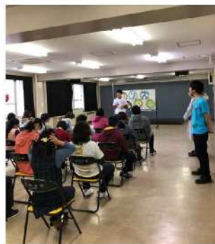
ワークキャンプ同好会 イベント名:福祉体験コーナー 場 所:2号館下ピロティグローバルプラザ 開催日時:5月21日(土)13:00~15:00