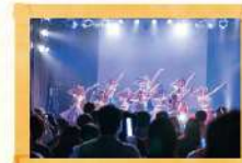
アイドル研究愛好会 [QanvaS]