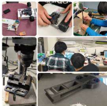
電気工学研究部 イベント名:制作物展示 場 所:8号館1階売店前ホール 開催日時:5月21日(土)12:00~18:00 5月22日(日)12:00~18:00