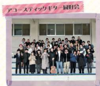
アコースティックギター同好会