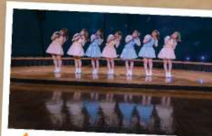
アイドル研究愛好会 【QanvaS】