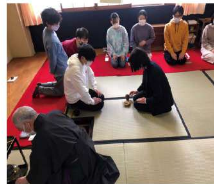
茶道部 イベント名:お茶会 場 所:8号館1階ホール 開催日時:5月21日(土)12:00~17:00