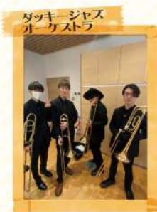
ダッキージャズ オーケストラ