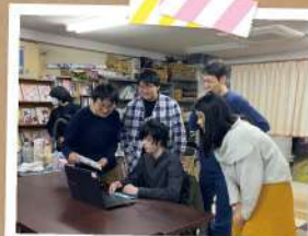
デジタルアート部