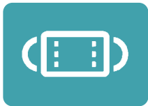
マスクの正しい着用