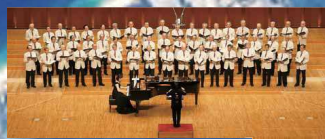
男声合唱団ジョイフル・スーペール