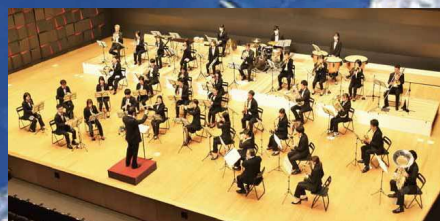
ウインド アンサンブル フロレス