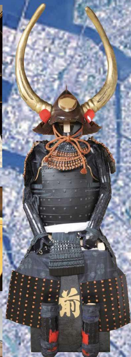
黒田良女申問 (香椎工業高校制作)