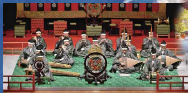
香椎宮雅楽保存会