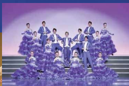
歌劇ザ・レビュー