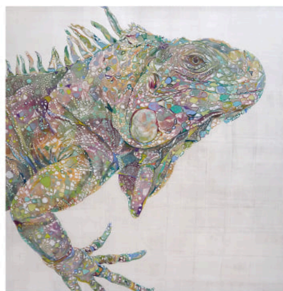
廣門愛由「囁き」 S60号(130×130cm) 高知麻紙、銀箔、水干絵具、岩絵具