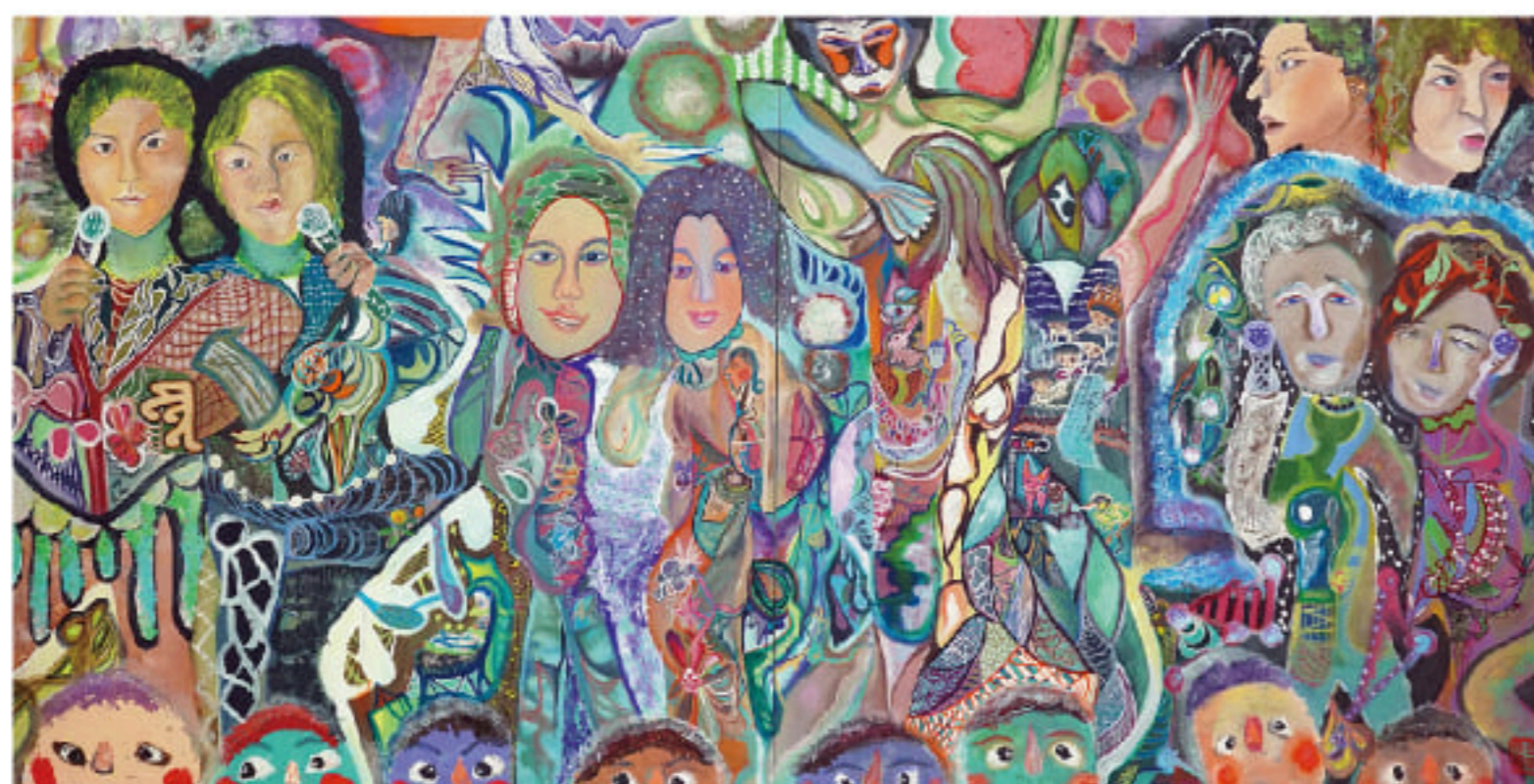
上田裕実子「ステージはやがて」 200号(162×324cm) 高知麻紙、水干絵具、岩絵具、アクリル絵具

九州産業大学の日本画は毎年1学年10人前後という学生数ではありますが、その中でも特に作家志望の強い学生を選抜し、 そこに卒業生を加えた5人で、今展の準備を進めてまいりました。 東京から1,000km以上離れた地で生まれた表現を是非ご高覧いただければ幸いです。