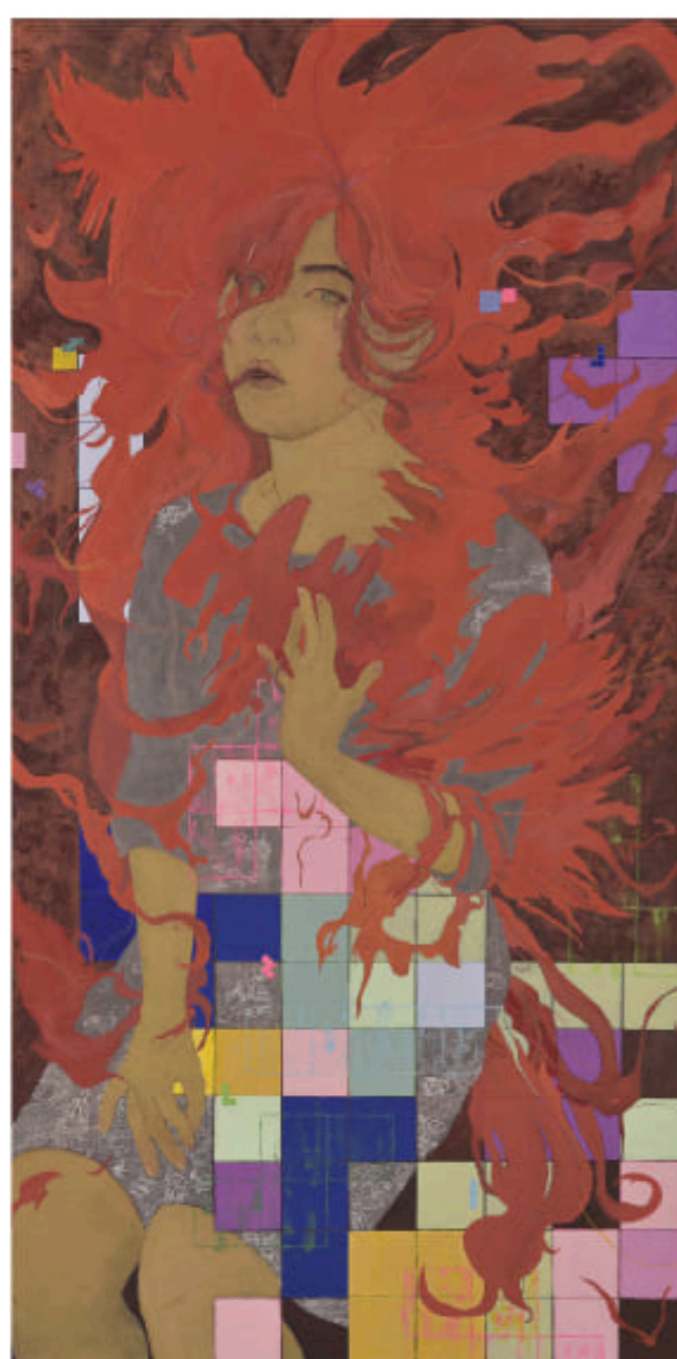
瀬口真梨奈 「メタモルフォーゼ〜針のむしろ〜」 M120号(194×97cm) 鳥の子紙、朱、水干絵具、岩絵具