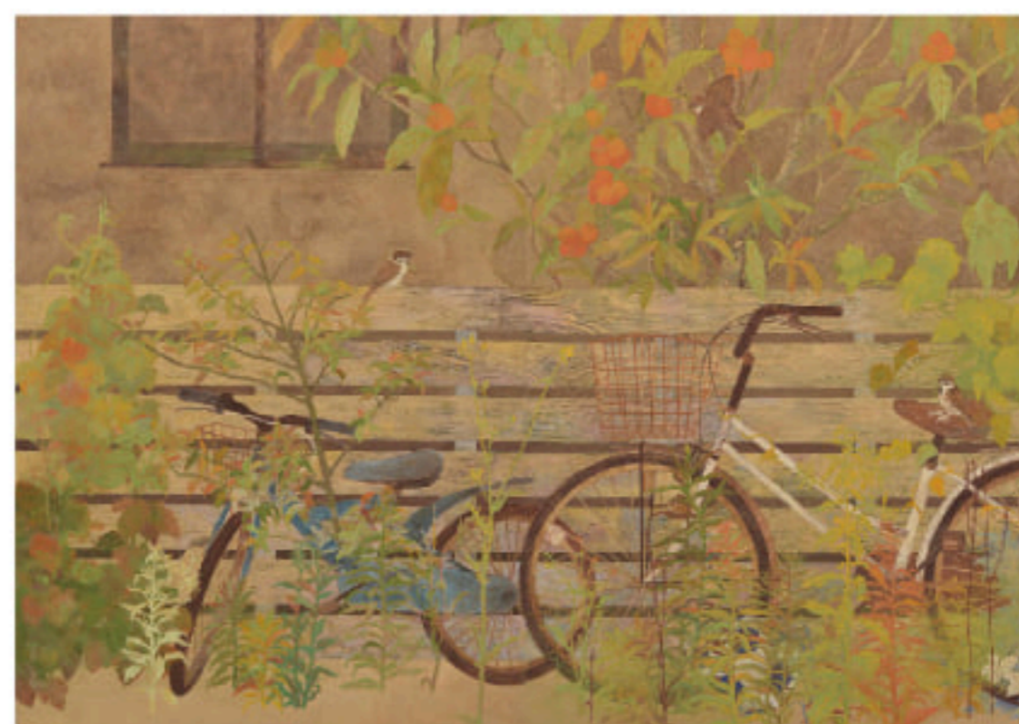
渡辺知聡「家路」 P150号(162×227.3cm) 高知麻紙、水干絵具、岩絵具