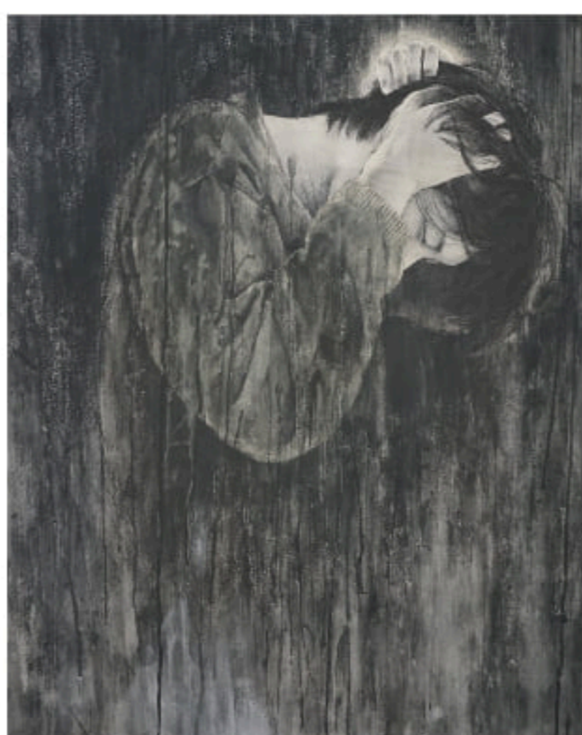
古賀雄大「懊悩」 F40号(100×80.3cm) 高知麻紙、墨、水干絵具、岩絵具