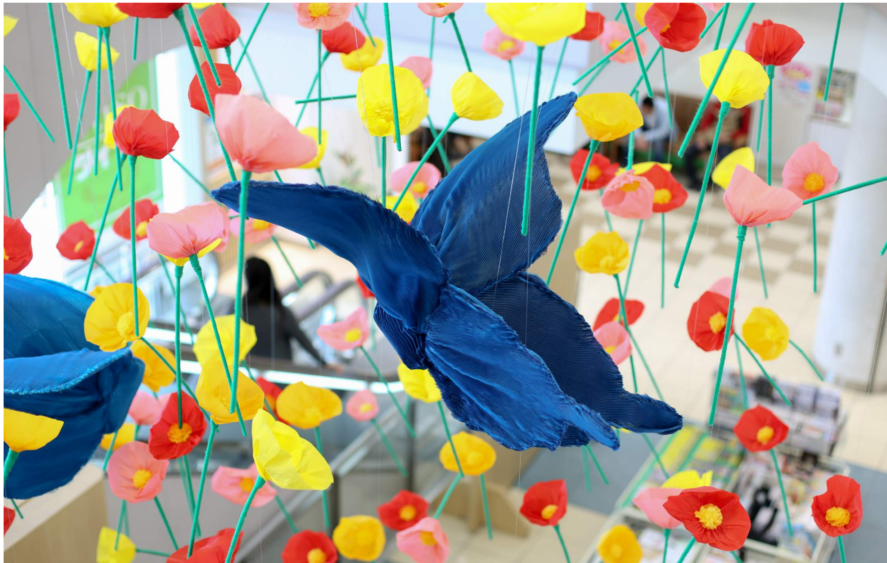
咲いた、咲いた、舞った -えきマチ1丁目香椎- 春の空間演出