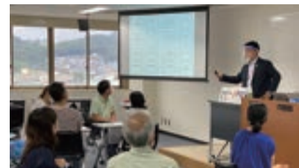
※2020年度 リカレント講座の写真