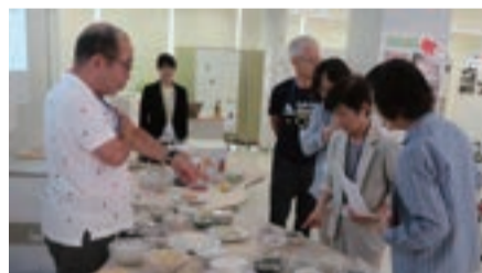
※2019年度 シニア・カレッジ講座の写真