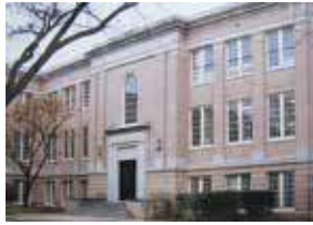
アビリン・クリスチャン大学 (アメリカ テキサス州)