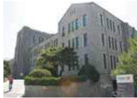
東国大学校 (韓国 ソウル特別市)