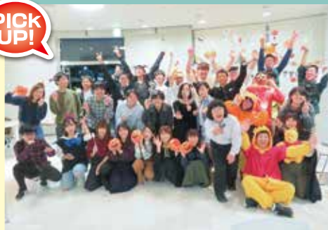
ハロウィンパーティ

”国際交流愛好会 International Bridge(通称IB)”が主催する国際交流イベントです。海外に興味を持つきっかけ作りとして活動しています。メンバーには、日本人学生、留学生のどちらも在籍しており、グローバルな視点で、国際交流イベント(ハロウィン、クリスマス等)を企画・運営しています!