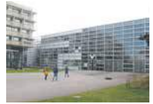
シュトゥットガルト造形美術大学 (ドイツ シュトゥットガルト市)