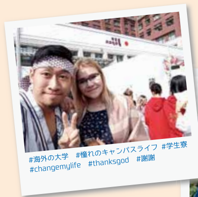
#海外の大学 #憧れのキャンパスライフ #学生寮 #changemylife #thanksgod #感謝