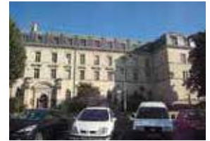
ボルドー美術学校 (フランス ボルドー市)