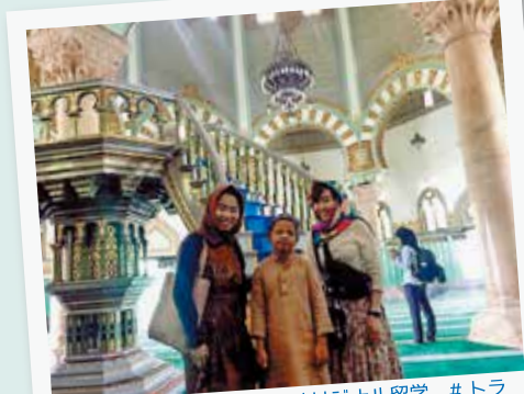
#カルチャーショック #オリジナル留学 #トラブルも楽しい #ボランティア活動 #旅部 #yolo #makemehappy