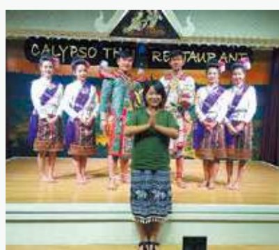
#一人旅 #人生観変わる体験 #冒険 #私だけのプラン #アジアを駆け抜ける #サマバケ #ファインダー越しの私の世界