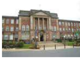
リーズ・ベケット大学 (イギリス リーズ市)