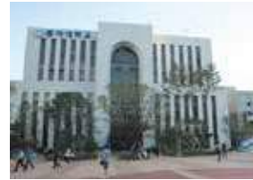
東亜大学校 (韓国 釜山広域市)