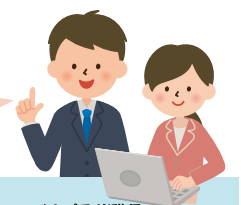
グローバルプラザ職員