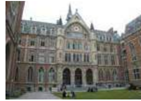
リール・カトリック大学 (フランス リール市)