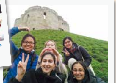
#半年間 #行ってきます #手厚いサポート #外国人の親友できた #語学留学 #出会いに感謝 #経験値 #wonderfulfriends