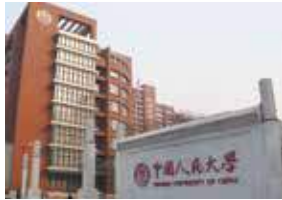
中国人民大学 (中国 北京市)