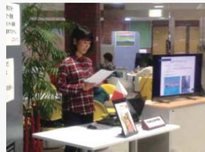
マルタ島での語学留学体験談