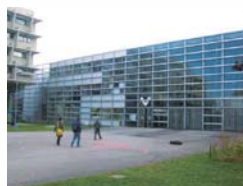
ドイツ シュトゥットガルト造形美術大学 http://www.abk-stuttgart.de/