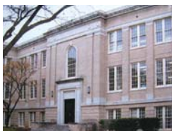
アメリカ アビリン・クリスチャン大学 http://www.acu.edu/