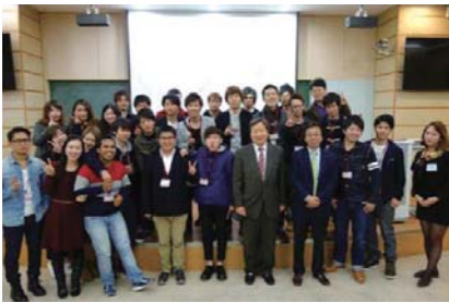
梨花女子大学校との学生・教員交流