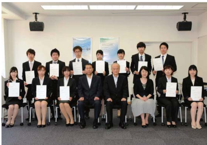
派遣留学許可書交付式

アビリン・クリスチャン大学 (アメリカ) 平成 26 年 8 月～平成 27 年 1 月