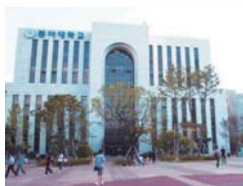
韓国 東亜大学校 http://ent.dongguk.ac/