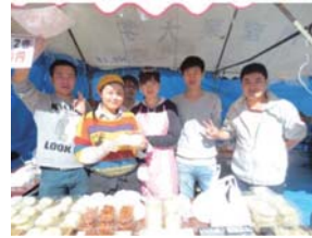
中国人留学生の香椎祭模擬店出店