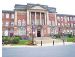
イギリス リーズ・ベケット大学 http://www.leedsbeckett.ac.uk/