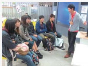
留学サポート会社による各種セミナー