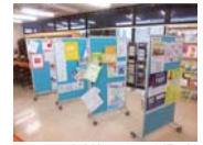
国際交流センター内掲示板

また、外国人留学生を対象とした履歴書の書き方やエントリーシートの書き方、面接試験の受け方など、就職活動に必要な本の貸し出しもしていますので、一度借りてみてはいかがでしょうか？