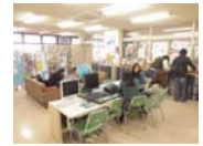
国際交流センター懇話室

現在、九州産業大学には500人を超える留学生在が在籍しています。留学生的の9割が中国からの留学生。その他に韓国、ベトナム、ネパール、台湾、バングラデシュ、インドネシア、ミャンマー、インド、モンゴル、ブラジル、アメリカ、イギリスなどから留学生在が来ています。国際交流センターには毎日多くの留学生在が来ており、留学生と話す機会を容易に持つことができますので、国際交流や語学に興味のある方は留学生と異文化交流してみたいかですか？