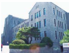
韓国 東亜大学校 http://www.dongguk.edu/