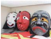
海外からの記念品の品々