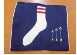
「友情の証」を表した作品

先生にデザインの方法などを聞いたりしました。そして、新たに作ったタペストリーには、友情の証として3本の矢を描きました。3本の矢を綺麗に同じ形にしたかったので、どうすればよいか先生に尋ねると、「その矢はとても綺麗ですよ。ハンドメイドは同じものは2度と作れないし、完璧にすることもできないが、それがハンドメイドの良さなのです」と言いました。それを聞いて私はホッとしました。なぜなら、前にも述べたように、完璧にコントロールできないものに大きな魅力を感じるからです。