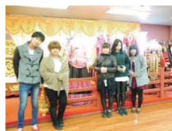
旅行でドラマ撮影地へ (本人写真一番右)

そうしてやっと自分の中で前進できそうな時に初めての試験に臨みましたが、納得できる結果ではありませんでした。それを踏まえ、今後どのように改善を行えばよいのか考えていた時、一緒に留学している友人が復習ノートを作成していることを知りました。私もそれを始めるとともに、疑問点はすぐ先生に聞き、個人的に連絡を行うようになりました。そのようなわずかなことを行うことによって、勉強したことがより頭に残るようになりました。また、韓国語を書くことを意識的に行う習慣も、以前より身につきました。この時から勉強に対して義務的というより意欲的になり、韓国人と気楽に話せるような変化や、他の留学生とのコミュニケーションの内容が深くなりました。このような生活をしていったおかげで、無事にクラス合格認定をもらい、その時の状況は今でも鮮明に覚えています。今の私がいるのは、この時のほんのわずかな変化から始まりました。