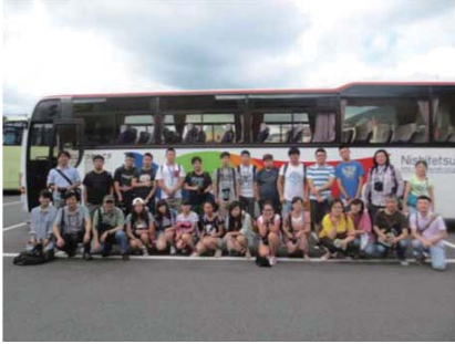
上海工程技術大学芸術設計学部との学生・教員交流