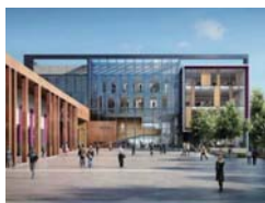
イギリス オックスフォード・ブルックス大学 http://www.brookes.ac.uk/