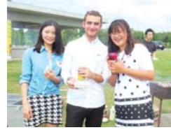
バーベキューパーティー (本人写真中央)