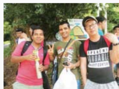
立花山ハイキング

平成25年度より始まった留学生チューター制度“TOP”は今年で3年目を迎えます。この“TOP”は、留学生在が学生生活をスムーズに送れるように、日本人学生が留学生的の学習面、生活面のサポートをする制度です。日本人学生は、年間を通じて開催される留学生在関連のイベントへの参加、相互学習をしながら語学力を伸ばすことができ、双方に多くのメリットがあります。毎年4月に募集を開始しますので、異文化交流に興味があり、留学生在と交流したい方はぜひ“TOP”に登録してください！