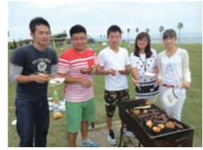
海の中道海浜公園でのバーベキューパーティー