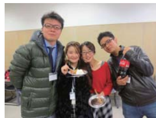
スピーチ発表者と来場者の様子