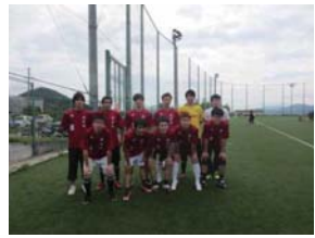
福岡県留学生会主催サッカー大会