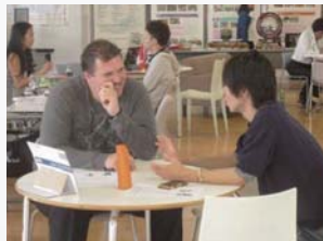
留学生から学ぶ外国語コーナー

来場した学生は、留学という同じ目標を持った友人との出会いや、外国人留学生と交流できる機会が持てたようです。留学をしてみたいと考えている方は、ぜひ来場ください！