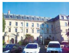
フランス ボルドー美術学校 http://www.ebacx.fr/