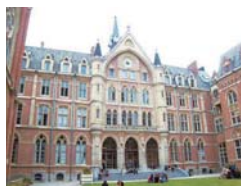
フランス リール・カトリック大学 http://www.univ-cochille.fr/