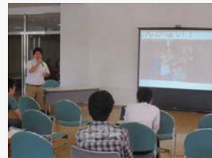
派遣留学OBによるキャリアアップ講演会