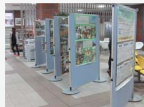
資料展示コーナー