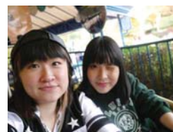
現地で仲良くなった友人と (本人写真右)

前半期の間は、慣れないことが多く忙しい日々もありましたが、この経験は成長するための道でもあったと考えています。