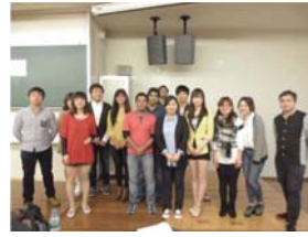
平成26年度 留学生会役員一同

一生懸命頑張ってください。皆さんが人生の目標を実現できるよう、心より祈っております。