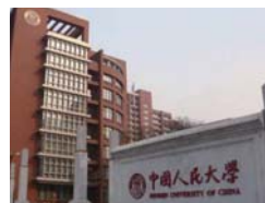
中国 中国人民大学 http://www.ruc.edu.cn/