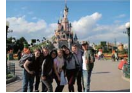
現地でできた友人と (本人写真一番右)

私は、今回のフランス留学でとても多くのことを学びました。最初は何も考えず、現地へ行けばどうにかならうと思っていて、不安は全くありませんでした。しかし、現実には上手く行かずとても大変なことが多かったです。フランスに到着して学校が始まるまで、初めて見る景色や、周りには日本人以外の人がいる環境にワクワクした気分でもありました。しかし、大学の正規の授業が始まる前にあったフランス語準備コースを受けた時、正直授業の内容についていけなくて、そこから不安が出てきて少し落ち込んでしまいました。そこで自分の考えが甘かったということに気づきました。そのコースは2週間程あり、受講している学生は他の国からの留学生合わせて16人ほどでした。周りには他の留学生はフランス語のレベルがとても高く、先生とも問題なく流暢に話していました。私はその授業でほとんどフランス語を理解することができませんでした。先生の話す速度にも、プリントにできる単語にも自分の知識は追いつかず、自分の部屋に戻っては勉強ばかりでした。この時思ったことは、言葉を聞き取るのはまだしも、今部屋でしていることは日本ででもできることで、なぜ留学前に勉強しなかったのだと後悔しました。これから留学をする後輩には、留学に行く前に語学力を増やすなど、日本でできることをしっかりして、海外では海外ならではの経験をして欲しいと思います。そして、そのフランス語準備コースが終わり大学の正規の授業が始まりました。私はとにかくフランス語を話せるようになることが目的だったので、映画を見て会話を学ぼうと考え、映画の授業を中心に授業を履修しました。実際の授業では気が付くことがたくさんありましたが、1つ言えることは、1つの講義の学生数は約10人で、気が付いたこと、疑問に思ったことをどんどん発言しながら、先生と会話をするような感じで授業が進んでいくということです。それでいて、学生もきちんと授業の内容を理解しながら講義が進んでいきました。また、フランスでの授業は黒板