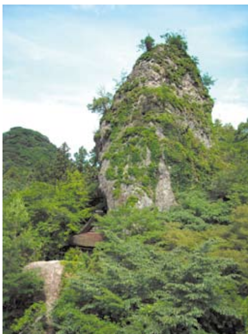
写真1 屏風岩と岩屋神社

ないが、この地区での生活者は岩屋社などで窟修行に励んだ僧侶であり、8世紀末からは岩屋本殿での修行が始まっている。宝珠山窟などの寺社を維持するためには、多くの人材や資金が必要であり、稲作も行われていた。農民からの徴税責任者は「名主」であるが、彦山神領では「専当・センドウ・（仙道）（仙頭）」とよばれていたという。竹地区には、小字名として仙道、川の名称として仙道川が見えることから、竹地区は彦山神領として成立したことが明らかである。