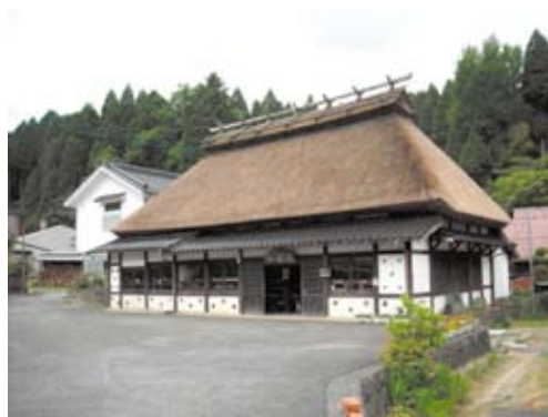
写真3 皿山地区の窯元