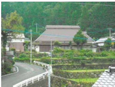
写真5 竹地区で最も古い民家

屋は、宝珠山地区で最も古い家屋であり、茅葺き屋根はトタンに覆われてはいるが、この地域の伝統的な建築様式を留めている(写真5)。同様の様式をもつ家屋は他に7軒ほど残存している。