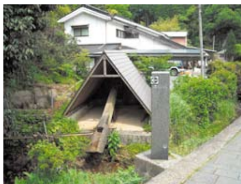
写真2 皿山地区に残る唐臼

かつては唐臼のたたく音が響いていたと思われるが、1基だけが皿山地区に遺産として残されているにすぎず（写真2）、それも現在は全く動いていない。観光資源となる唐臼