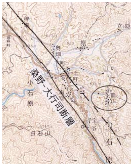
図2 小石原地区の概要 (1:50000 「吉井」)

小石原川の上流部の沈降によって谷が埋設されて盆地状になったのであり、図2の稗畑、奥畑、原集落周辺の水田は、その盆地上に形成されている。一方、断層線より下流側の小石原川は山地の隆起により、下方侵食が大きくなって、先行谷の形状をなしている。