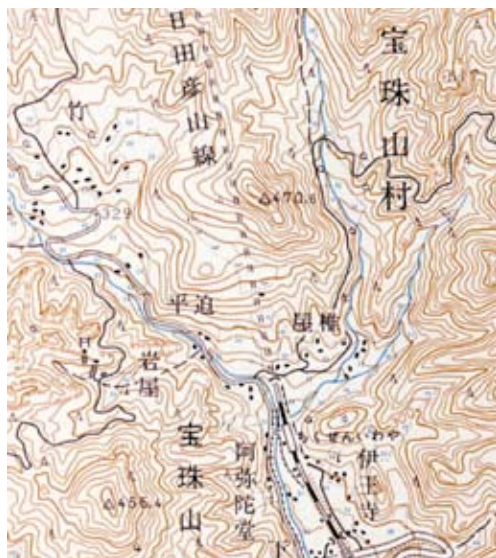
図3 竹・岩屋地区の概要 (1:25000「英彦山」による)

岳・岩屋地区は大日岳火山の火砕流堆積物が固結した凝灰角礫岩や凝灰岩である。凝灰岩は、侵食に対する抵抗力が弱くて侵食されやすいので、大小の角礫を包含した角礫凝灰岩が残って奇岩を呈すようになったのである。