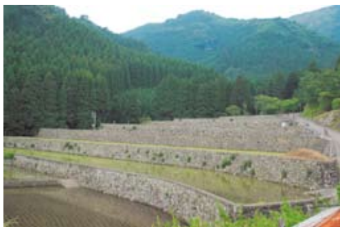
写真6 きれいに手入れがなされた棚田。一部に茶が植えられている。

現在、棚田は地元民によって良く手入れがなされている。年2回、棚田の石垣に生える雑草取りが行われている。かなり大変な労働であるというが、この作業は棚田斜面の崩壊を防ぐだけではなく、石垣を美しく見せるためでもある。一部の石垣には茶の木を植えているが、茶の飲用という実用面と景観美を兼ね備えたものである（写真6）。