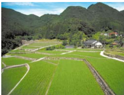
写真4 竹の棚田地区

また、棚田を所有する農家は、棚田の下方にまとまって集村形態をとるのではなく、2~3戸の農家がまとまって斜面に立地しているのが、他の棚田地域には見られない竹の特徴をなしている(写真4)。また、母屋の多くは日本瓦の和風建築となっているが、棚田交流館から北に見える寄せ棟造りの農家の母