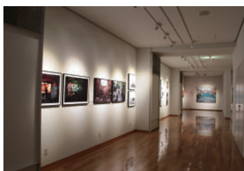
昨年度の展示の様子

2022年2月18日(金)～27日(日) ※会期中は休館日なし 学内各所を会場に開催する2021年度卒業・修了の大学生・大学院生の制作作品展。美術館では大学院芸術研究科修了制作作品を展示します。