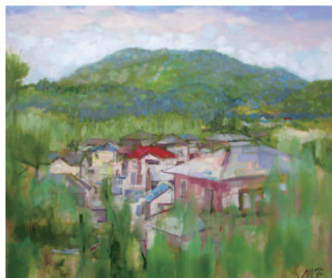
古本元治《庭より》2016年