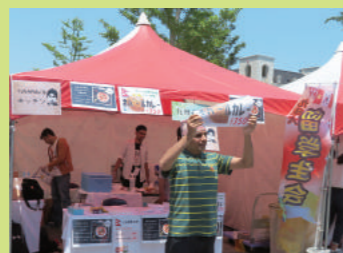
留学生のネパールカレー販売

芸術文化を感じられるまちづくりを進めるために、開催されています。芸術学部や造形短期大学の学生のほか、留学生も参画します。