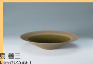
福島 善三 「鉄釉掛分鉢」

Art(芸術)の世界を生み出す多様なMaterial(素材)の魅力を紹介します。