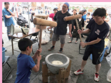
準硬式野球部「奉納餅つき」

8日は、御神前に御供えをする初刈神事や獅子舞が、9日には扇供養祭が行われます。芸術学部や準硬式野球部の学生が今年も参画します。