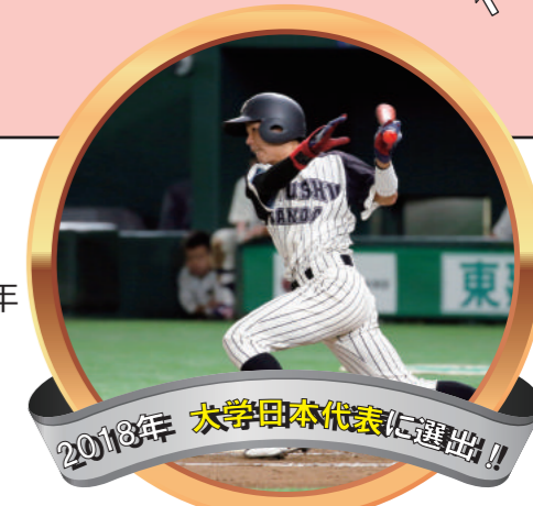
2018年 大学日本代表に選出!