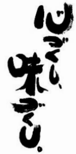
←グランプリ受賞作品 選択課題 「心づくし、味づくし。」(食品)