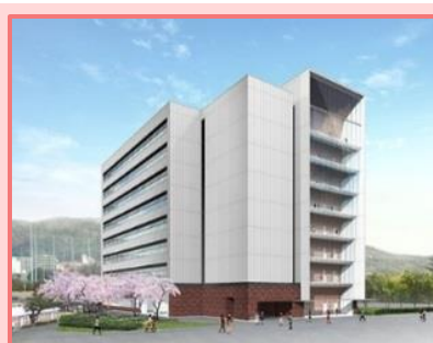
人間科学部新棟(3号館)