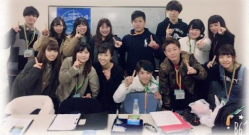
▲実行委員メンバーのみんなと

私は、市政だよりを見て応募し、5月から14人の委員とともに12回の会議などで企画を検討し、実施しました。