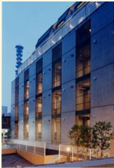
荒木町集合住宅／東京都／2003