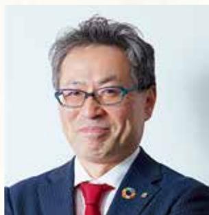
九州産業大学学長 榎 泰輔