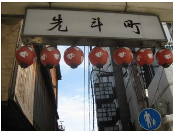
先斗町四条通の入口