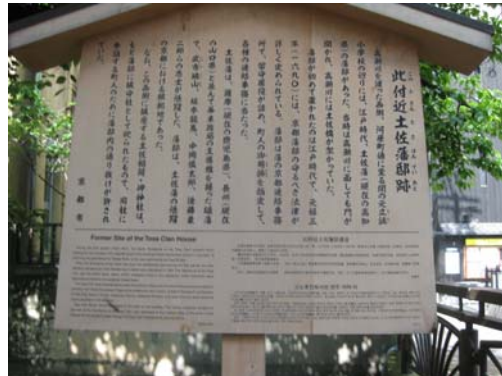
土佐藩邸跡の説明版