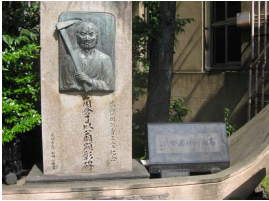
角倉了以翁顕彰碑