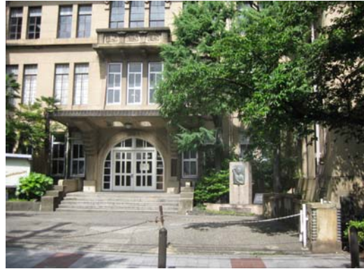
旧立誠小学校にある角倉了以翁顕彰碑