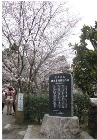
野鳥橋の緒方春朔顕彰の碑