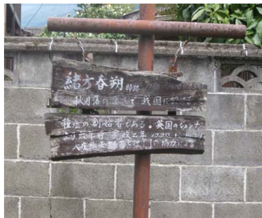
緒方春朔の説明板