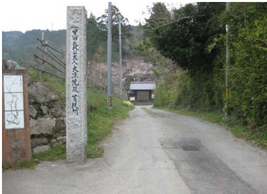
黒田長政公夫人大涼院殿菩提（大涼寺）