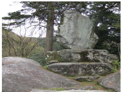
えりのぶたか 恵利暢堯殉節碑