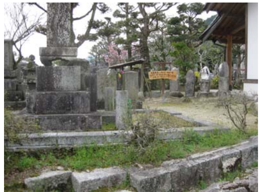
古心寺（黒田家菩提寺と臼井親子の墓）