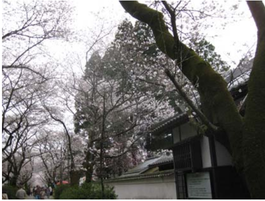
杉の馬場（秋月美術館）