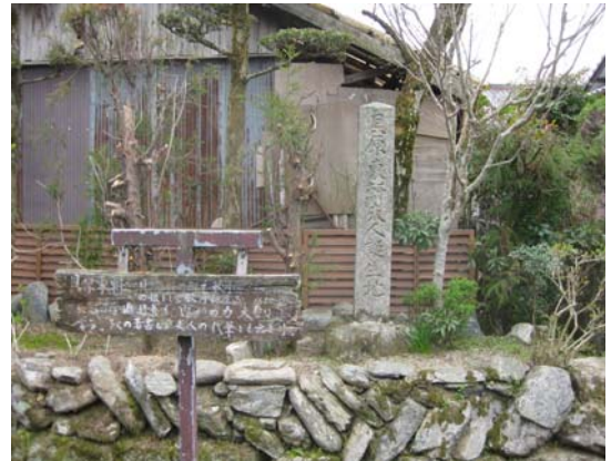
貝原東軒生誕地の碑