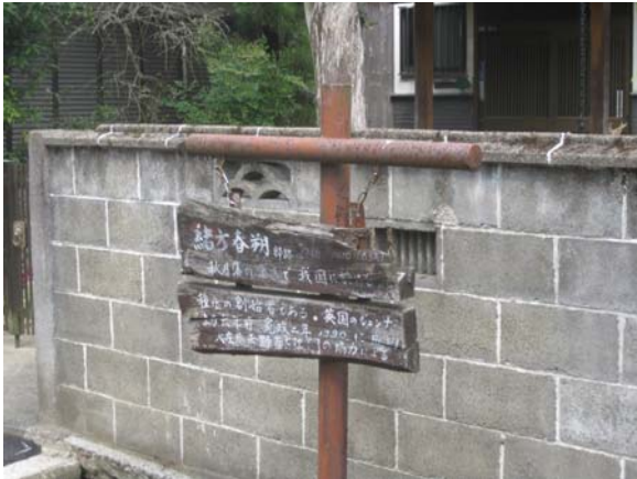
緒方春朔の説明板