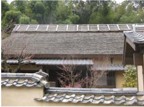
旧田代家住宅（武家屋敷住宅）