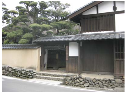
秋月武家屋敷久野邸