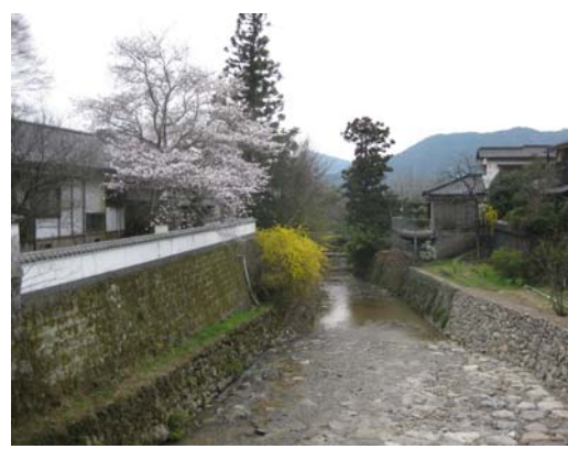
野鳥川（野鳥橋から東側）