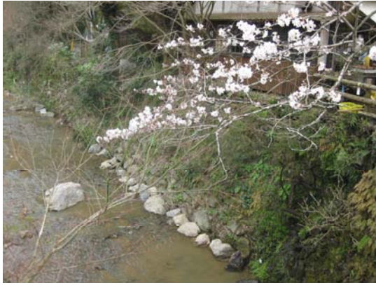
野鳥川（野鳥橋から東側）