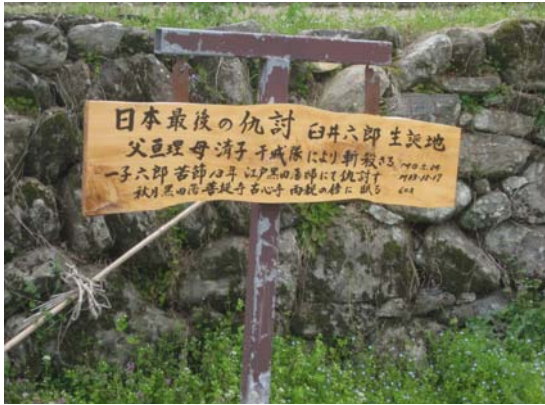
白井六郎生誕地の説明板