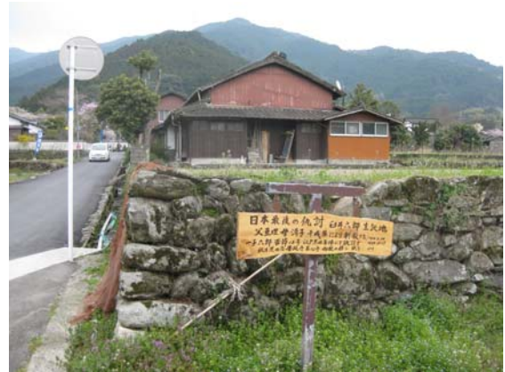
白井六郎生誕地の説明板（秋月郷土館から西へ約 150m）