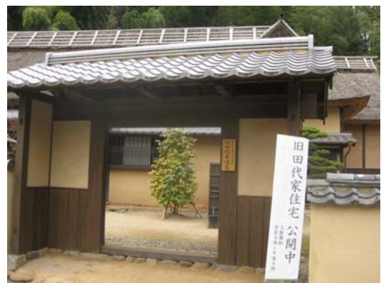
旧田代家住宅（武家屋敷住宅）