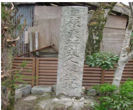
貝原東軒生誕地の碑