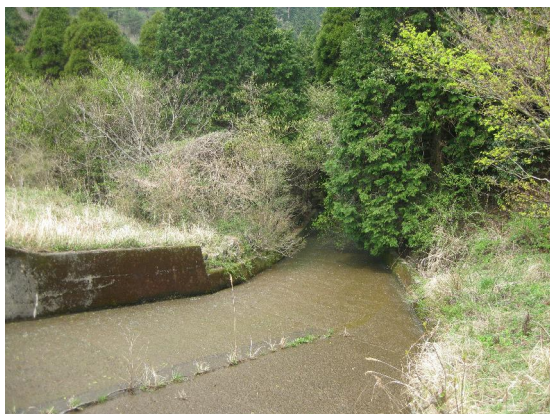
棚田に送水するための管理システム