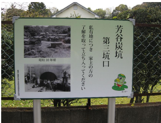
芳谷炭坑第三坑口の説明版