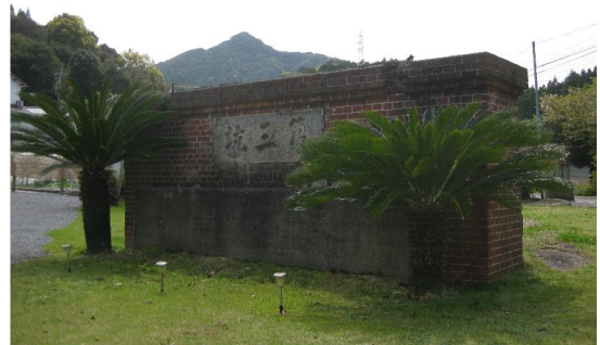
芳谷炭坑第三坑口