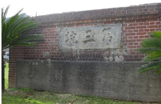
芳谷炭坑第三坑口