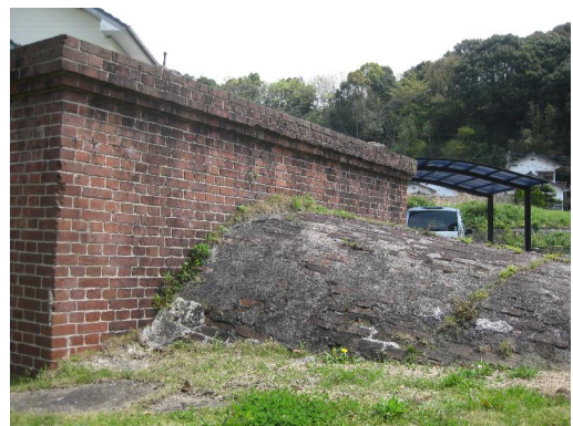
芳谷炭坑第三坑口