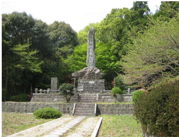
肥前久保駅そばにある幡随院長兵衛誕生地の碑