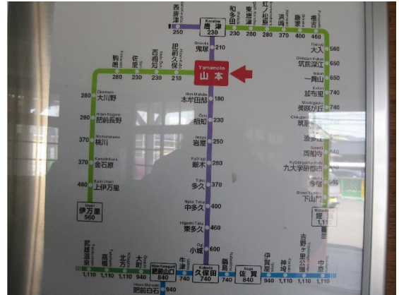
山本駅舎内にある路線図