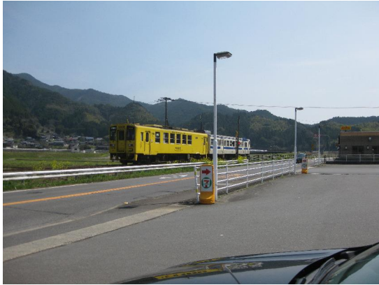
唐津線で佐賀方面へ行く電車