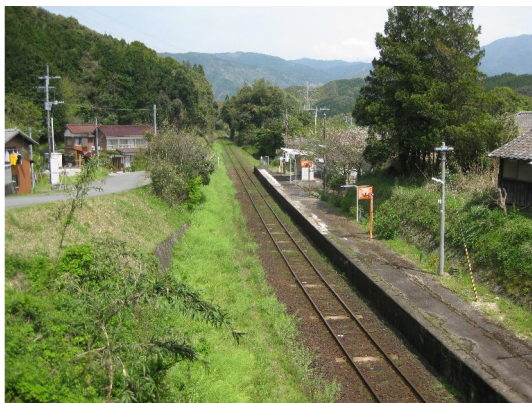
筑肥線肥前久保駅（その昔、幡随院駅）