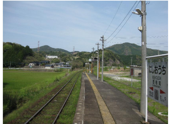
筑肥線西相知駅から肥前久保方面、この線路の左側が相知町町史によれば、炭坑跡としての地図が掲載されている。