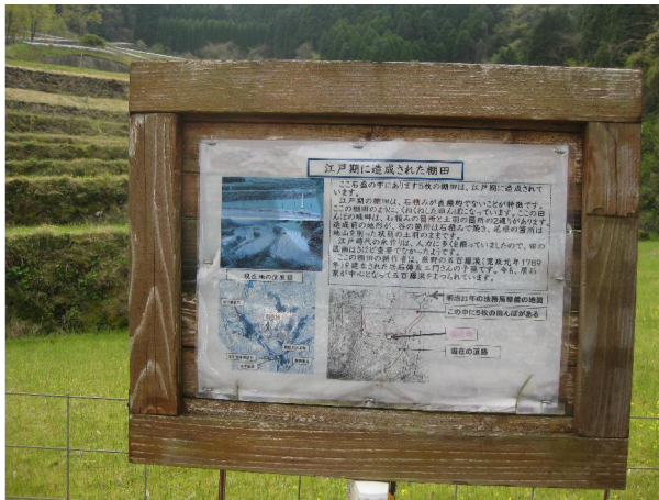
蕨野棚田の江戸期からの説明版