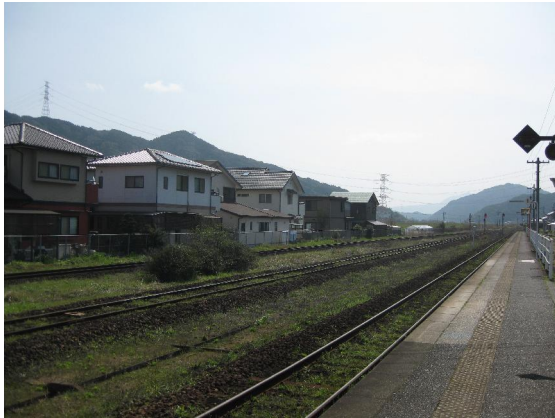
山本駅構内（伊万里・久保田方面）