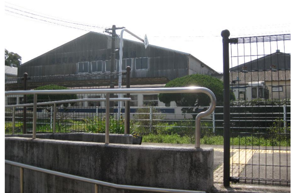
相知駅（唐津線）を唐津方面に発射する電車