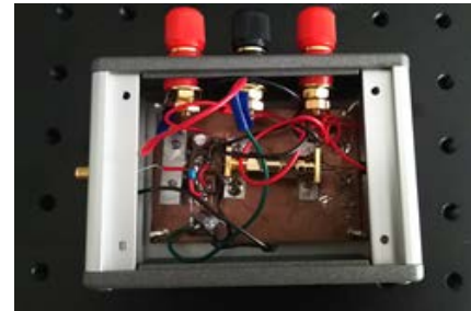
試作した光受信 フロントエンド部の例